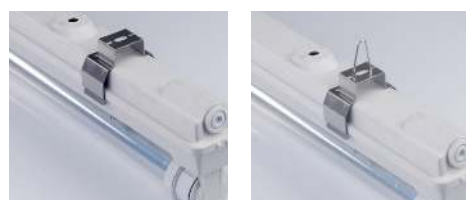
Version T8 : étrier et crochet de suspension