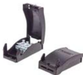
Bornier de repiquage